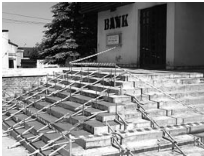
Remont schodów i elewacji budynku mieszczącego ośrodek zdrowia oraz bank.