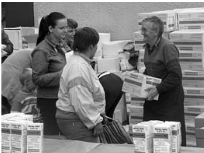
Paczki żywnościowe dla podopiecznych GOPS

Gminny Ośrodek Pomocy Społecznej w Lutomiersku nawiązał współpracę ze Stowarzyszeniem „Szansa” w Pabianicach w ramach Programu PEAD 2006 w zakresie pomocy na rzecz wyrównywania poziomu życia rodzin i osób z terenu gminy Lutomiersk. W ramach programu otrzymano 7 ton artykułów spożywczych (mąka, cukier, ryż, kasza, makaron, mleko w kartonach, serki topione). Artykuły te w dniu 07 czerwca 2006 r. zostały rozprowadzone wśród podopiecznych GOPS. Z tej formy pomocy skorzystało 180 rodzin.