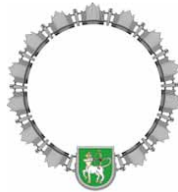
Łańcuch Przewodniczącego Rady Gminy Lutomiersk

Wydawca: Gmina Lutomiersk, 95-083 Lutomiersk, Pl. Jana Pawła II 11