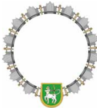
Łańcuch Wójta Gminy Lutomiersk

Wykorzystany w pieczęciach i łańcuchach herb Gminy Lutomiersk uzyskał pozytywną opinię Ministra Spraw Wewnętrznych i Administracji w roku 2003.