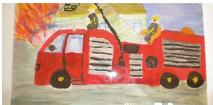
oprac. Jolanta Nieoczym