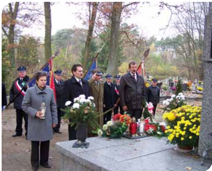
Władze samorządowe, kombatanzi i druhowie OSP złożyli wiązanki kwiatów i zapalili znicze w miejscach pamięci na terenie gminy Lutomiersk